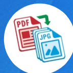
File : JPG, PDF